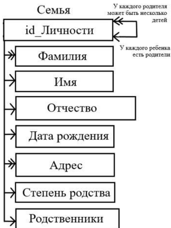
Рис. 1. Диаграмма «сущность-связь»

Создание базы данных «Состав семьи» было осуществлено по программе Microsoft Access (рис. 2).