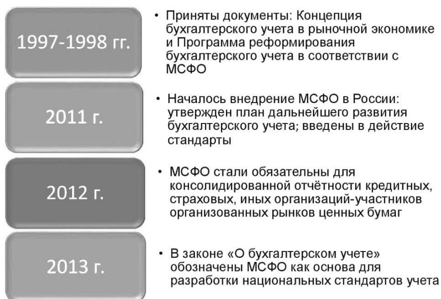
Рис. 1 – Этапы перехода России на МСФО.

В минувшее время этот стартовый переход ускорился больше, поскольку российское правительство определило необходимость приведения принципов бухгалтерского учета в России в соответствие с принципами МСФО. Даже после того, как это произошло, предыдущие традиции продолжают оказывать негативное влияние на разработку учетной политики. Правда, сегодня уже созданы принципы, соответствующие принципам МСФО, применение этих принципов на практике по-прежнему производит негативный эффект.